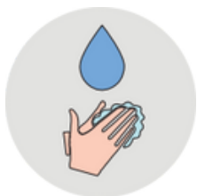
Lavez-vous les mains avant de toucher le masque