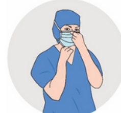
Étendre le masque au-dessus du nez et en-dessous du menton. Pincez la barrette au niveau du nez pour assurer l'ajustement du masque