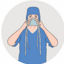
Prendre le masque face blanche côté visage