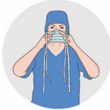
Prendre le masque face blanche côté visage