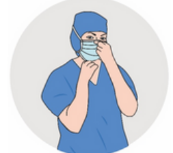
Étendre le masque au-dessus du nez et en-dessous du menton. Pincez la barrette au niveau du nez pour assurer l'ajustement du masque